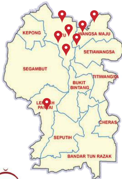
مسجد جامع فكن سنٲول MASJID JAMEK PEKAN SENTUL JALAN HAJI SALLEH, 51100, KUALA LUMPUR