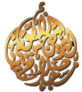
Masjid Salahuddin Al- Ayubi, Zon 2