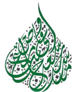
Masjid Jamek Saad Bin Abi Waqqas, Zon 2